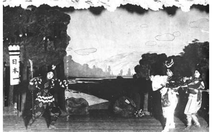
歌舞剧《桃太郎（ドンブラコ）》剧照