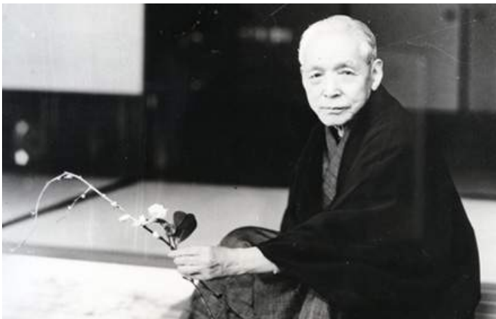
宝冢歌舞剧之父小林一三先生

宝冢歌舞剧的座右铭“清纯、正直、美丽”是小林一三先生的教诲。小林先生以创办“适合合家观赏的国民剧”为目标，留下这句教诲，期许少女们不只要钻研基本的演艺技能，还要注重礼仪与规范，不忘身为一位女性及社会人士应有的品格。不论时代如何变迁，这项精神皆深植于所有宝冢少女、所有工作人员的心底。