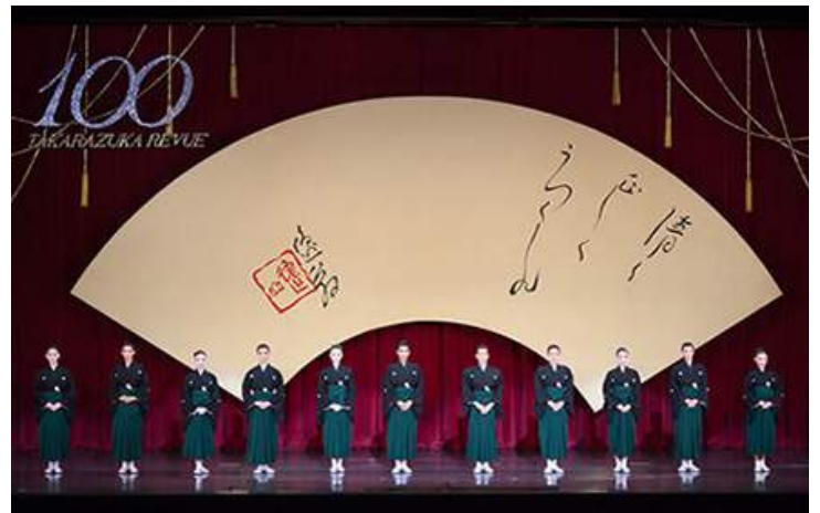
宝冢歌舞剧100周年纪念致词（2014年）