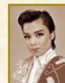
峰 さを理 1972~1987