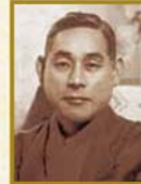
坪内 士行 演出