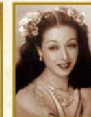
淡島 千景 1941~1950