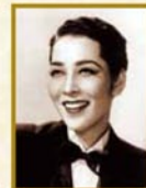
越路 吹雪 1939~1951