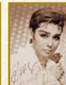
古城 都 1960~1973