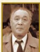
渡辺 正男 装置