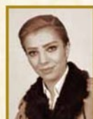
鳳 蘭 1964~1979