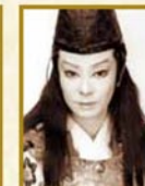
甲 にしき 1960~1974