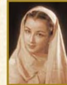
八千草 薫 1947~1957