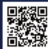
お申込みフォーム

※公演中止などのやむを得ない場合、イベントを中止させていただく場合がございます。