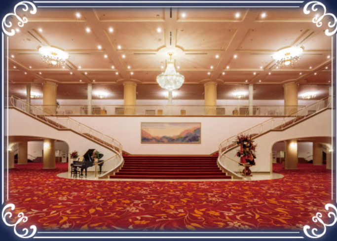
※宝塚大劇場ロビー