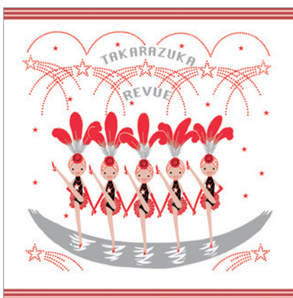
ラインダンス・レッド