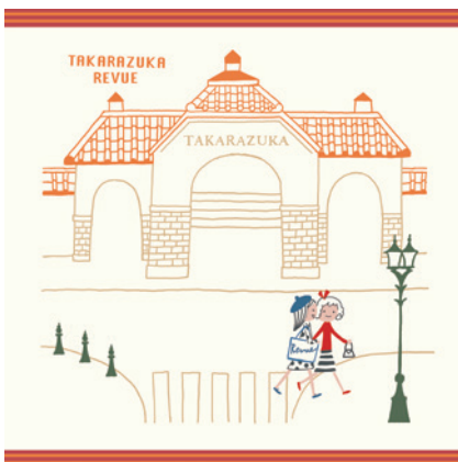
宝塚大劇場と女の子