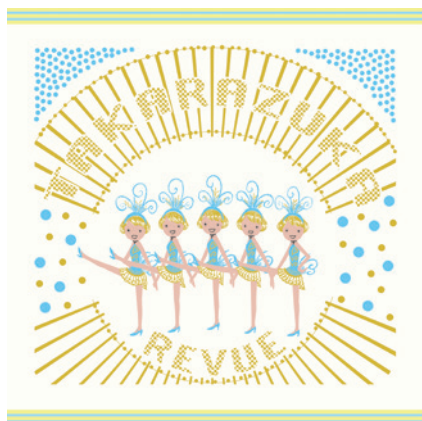
ラインダンス・ブルー