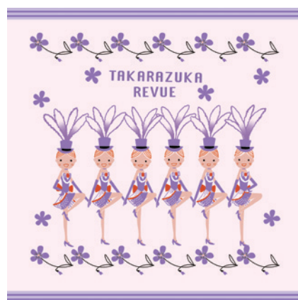
ラインダンス・パープル